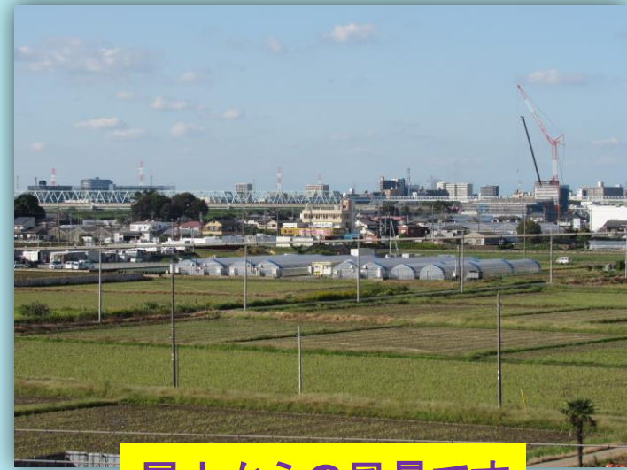
屋上からの風景です