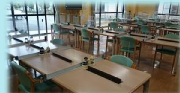
食堂 (ディスタンスとパーティションを設置しています)

将来、身体機能が低下、虚弱化しても、ホームヘルパー等の在宅サービスを併用していただくことで、日常生活を維持できる限り、ケアハウスでの生活継続は可能です。