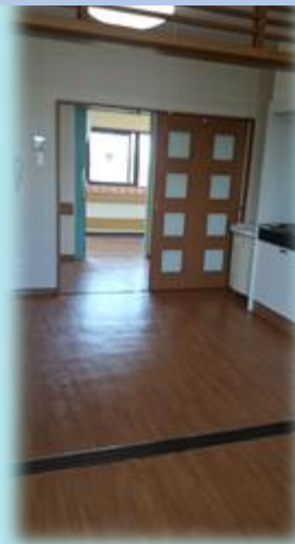
奥より部屋の全体観