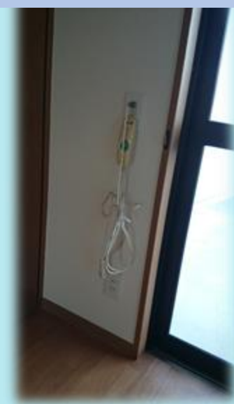
各居室にナースコール