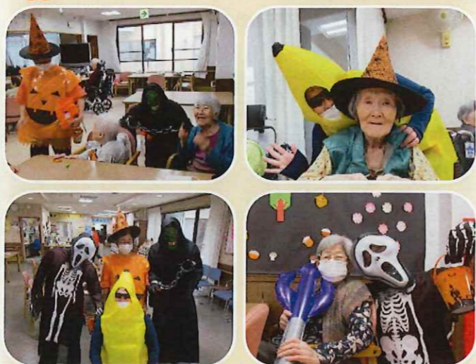
トリックオアトリート！陽光苑は賑やかな1日になりました。オバケの仮装に思わずニコリです。

行事・イベントの他に毎月の誕生日会も行っています。来年も沢山の行事やイベントを企画しています。