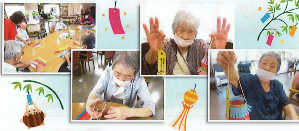
七夕飾りを制作し記念撮影。皆様のお願いを天の川へ届けました。