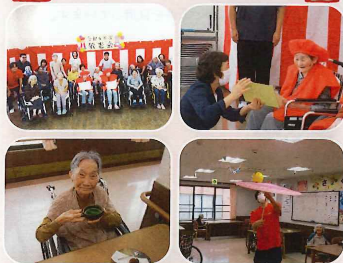
今年も入所者様の長寿祝いをさせて頂きました。職員のお祝かかし芸に思わず皆さん大拍手！