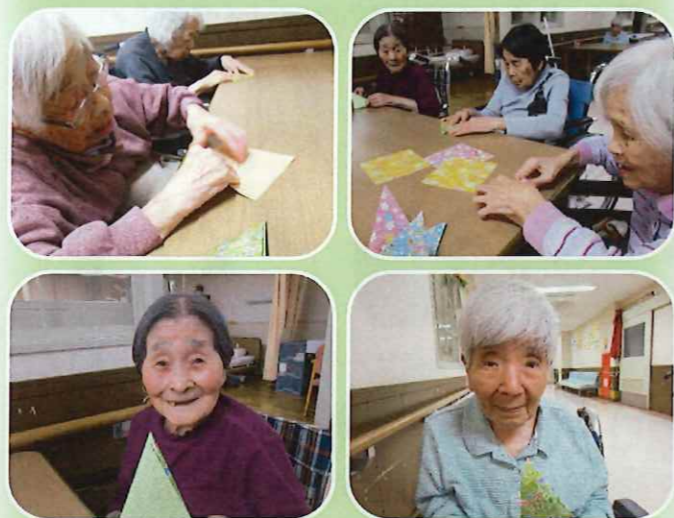
7月の七夕に向けてカラフルな折り紙で七夕飾りを制作中、皆さんとっても指先が器用ですね！