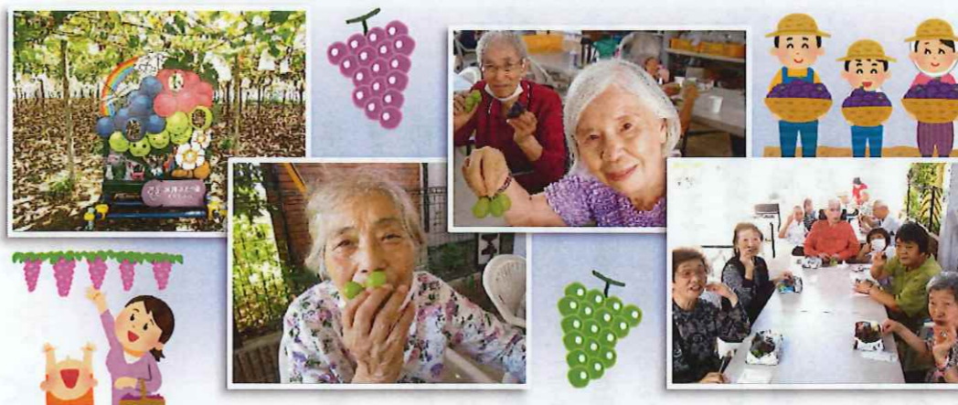
加藤ぶどう園に行きました。甘酸っぱいぶどうの試食に皆さん大満足です！