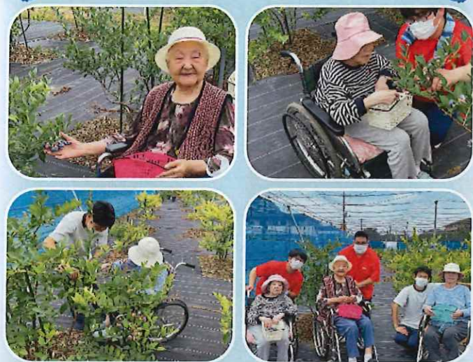
久しぶりの外出で皆さん上機嫌、採れたて新鮮なブルーベリーを頂きました。